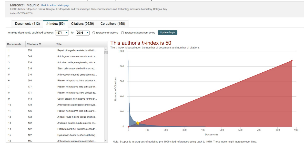
Tabella n. 1 – H-index complessivo (1974-2016)